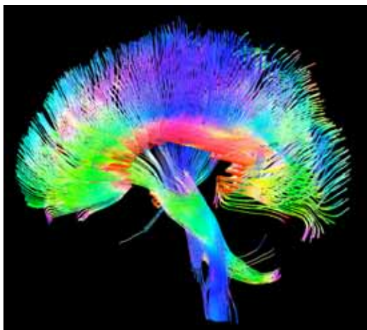
Il cervello emozionale umano in MRI ha funzioni importanti. spesso rennesse.